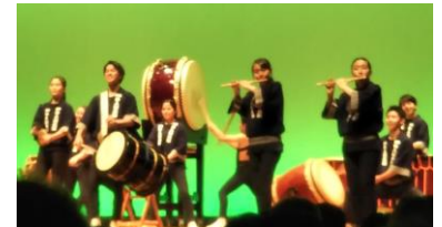
和太鼓部の見事な演奏風景！

6月22日、保土ヶ谷公会堂において「第9回定期演奏会『結』」が開催されました。毎年とても楽しみにしている和太鼓部の演奏はいつもながら見事で、満員の観客は大満足！ 内進生の高校生が活躍する中、中学生たちの頑張りがキラキラ輝いていました！